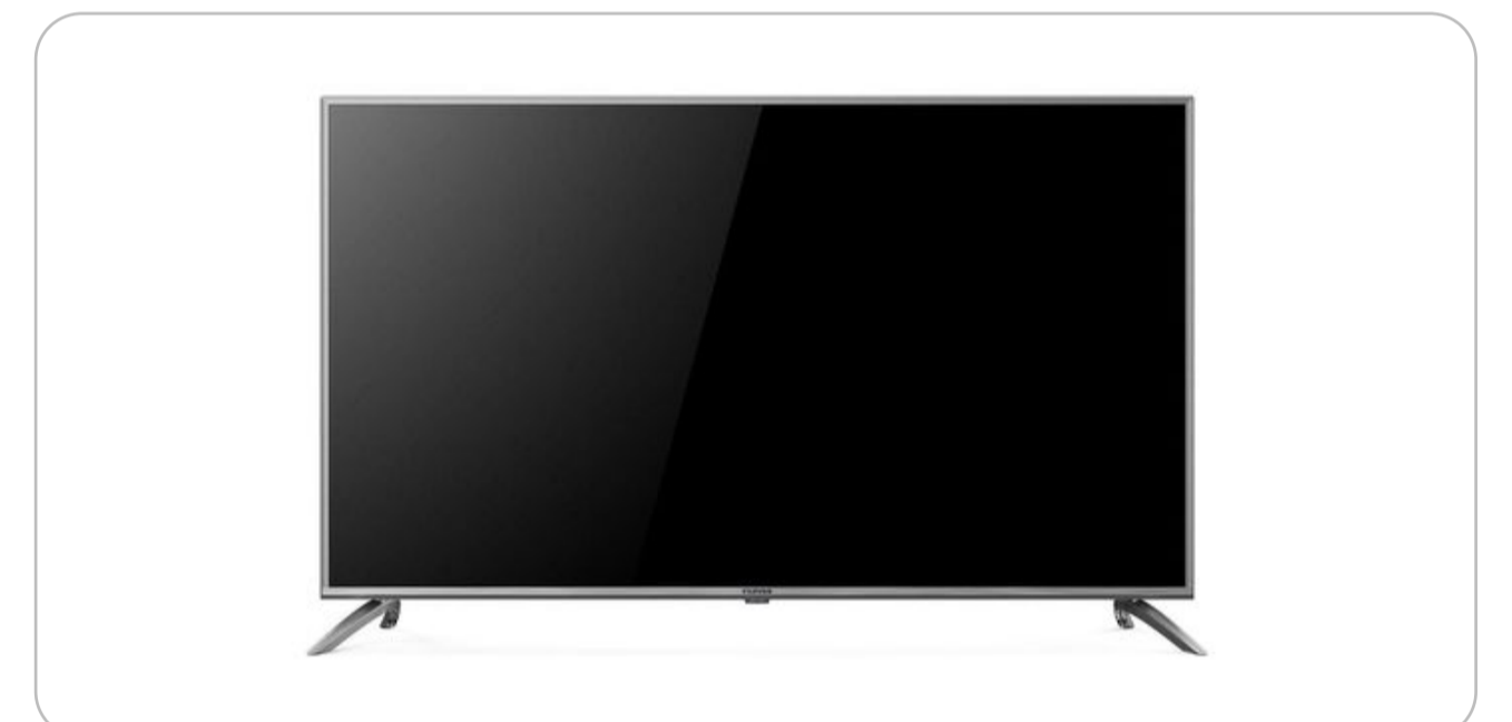
Телевизор с функцией Smart TV