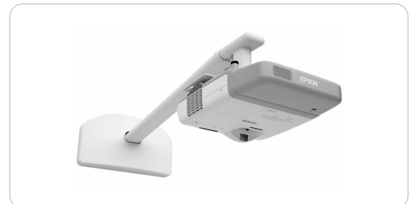
УКФ проектор с настенным креплением