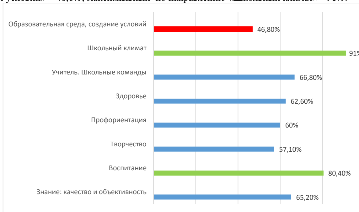
Диаграмма №4 - Проценты от максимального балла

Из диаграммы № 4 видно, что минимальный балл в МОУ (% от максимального балла по направлениям) по магистральному направлению «Образовательная среда, созданий условий» – 46,8%, максимальный по направлению «Школьный климат» - 91%.