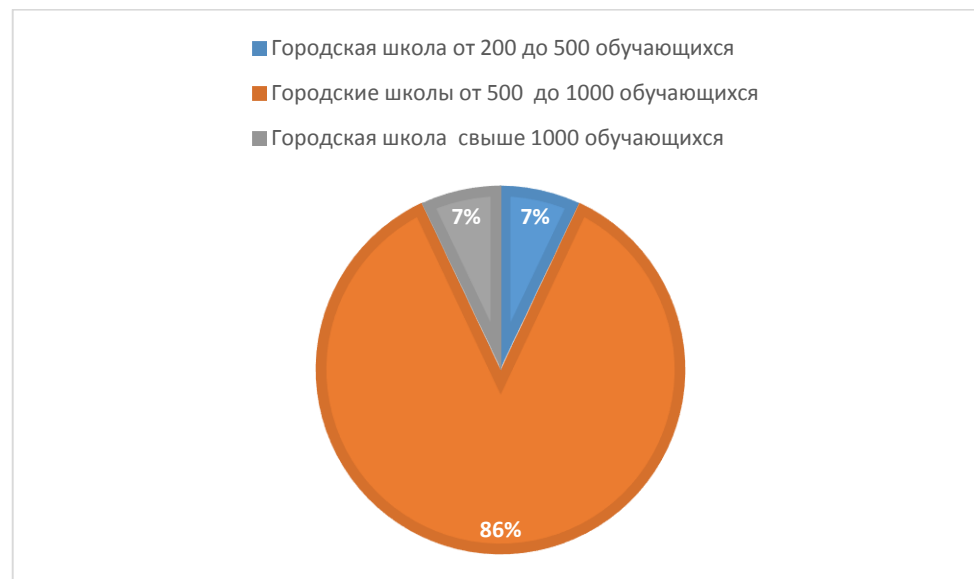
Диаграмма №1 - Распределение МОУ, принявших участие в самодиагностике, по виду

Ключевым моментом в обработке результатов данной информационно-аналитической справки также стала классификация МОУ по уровням освоения модели «Школы Минпросвещения России»: базовый (минимально достаточный), средний, полный (эталонный) (Концепция (проект) «ШКОЛА МИНИСТЕРСТВА ПРОСВЕЩЕНИЯ РОССИИ» ( https://smp.iuorao.ru/ ).