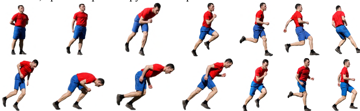
Рис. 6. Челночный бег 10×10 м

При нарушении условий выполнения упражнения предоставляется вторая попытка, при повторном нарушении норматив считается невыполненным.