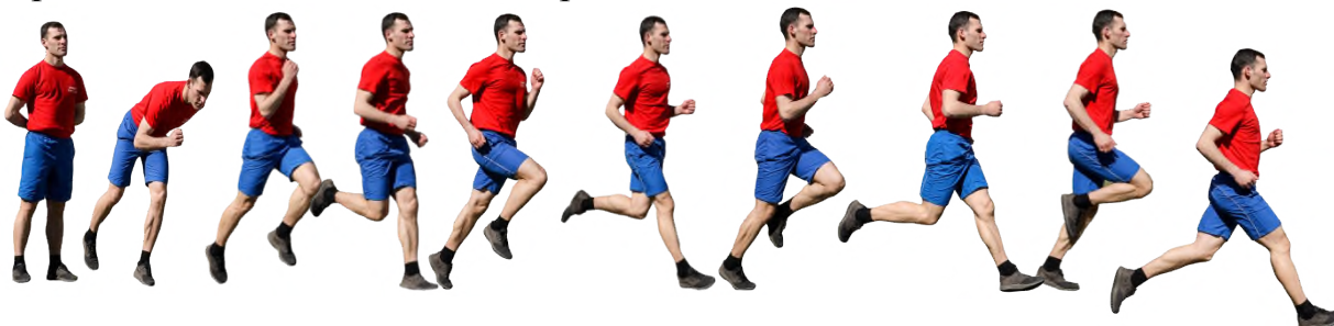
Рис. 7. Бег на 1 км, бег на 3 км.

Старт и финиш, как правило, оборудуются в одном месте. При выполнении упражнений на беговой дорожке стадиона старт и финиш производится в соответствии с разметкой стадиона.