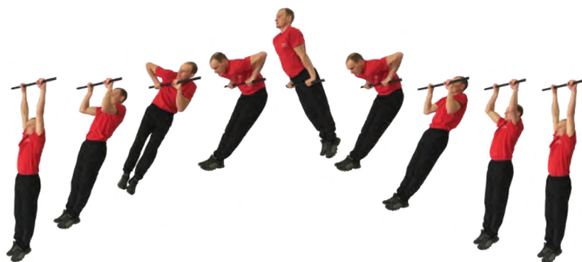
Рис. 3. Подъем силой на перекладине