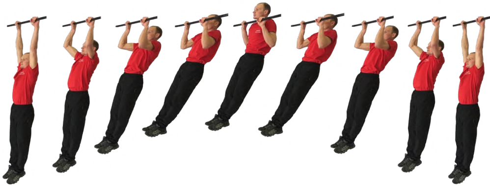
Рис. 1. Подтягивание на перекладине