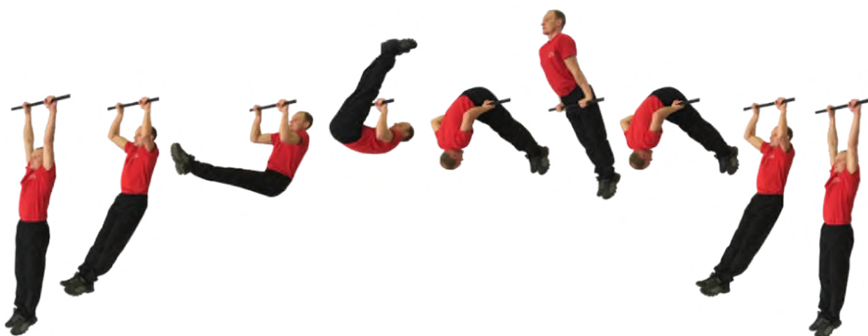
Рис. 2. Подъем переворотом на перекладине