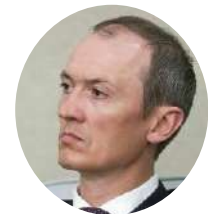
Вице-премьер РФ — руководителя аппарата Правительства Дмитрий Григоренко

Ранее из-за отсутствия финансирования школы и другие бюджетные учреждения могли «не соблюдать какие-то правила», а потом в рамках проверок надзорные государственные органы «наказывали самих себя, вынося штрафы» Это выглядело странно. Мы решили эту задачу, как обещали, у нас на сегодняшний день такие проверки запрещены, это все переведено в режим профилактики, которая запрещает штрафовать, но при этом дает рекомендации на предмет выявления нарушений и исправления, если такие есть