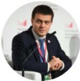
Котюков Михаил Заместитель министра финансов России