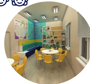
ЦЕНТРЫ ДЕТСКИХ ИНИЦИАТИВ