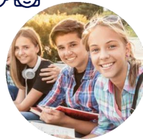
ДЕТСКИЕ ОБЩЕСТВЕННЫЕ ОБЪЕДИНЕНИЯ