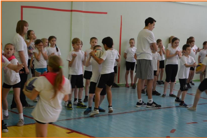
«Самый сильный», «Самый меткий»