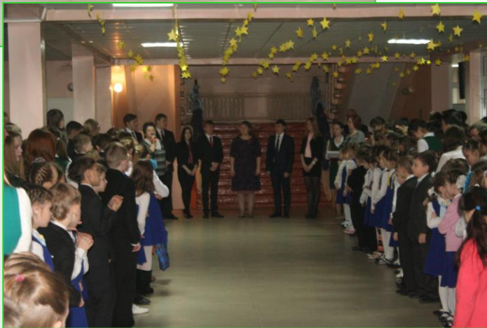
Лицейская проповедь «Краски жизни»