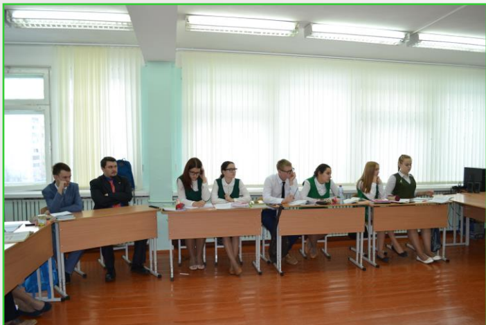
Классный час «Радость общения»