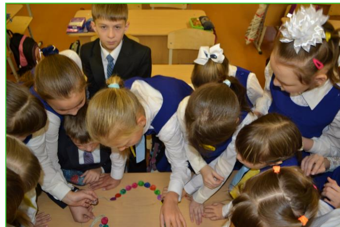
Классный час «Радость общения»