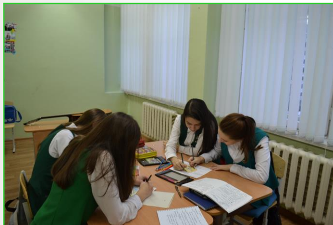
Классный час «Рисуем общение»