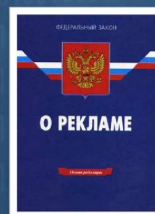
Федеральный закон Российской Федерации № 38-ФЗ «О рекламе»