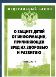
Федеральный закон Российской Федерации № 436-ФЗ «О защите детей от информации, причиняющей вред их здоровью и развитию»