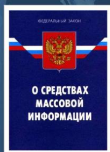
Федеральный закон Российской Федерации № 2124-1 «О средствах массовой информации»