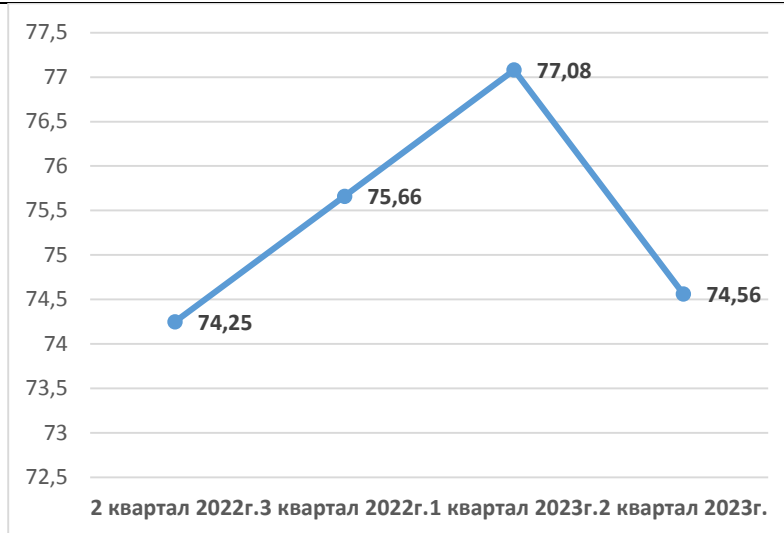
Рисунок 1. Динамика укомплектованности кадрами

Укомплектованность кадрами имеет прямую математическую зависимость от количественного состава работников учреждения и как следствие резкий скачек в первом квартале 2023г. также объясняется индивидуальными особенностями кадровой политики каждого образовательного учреждения.