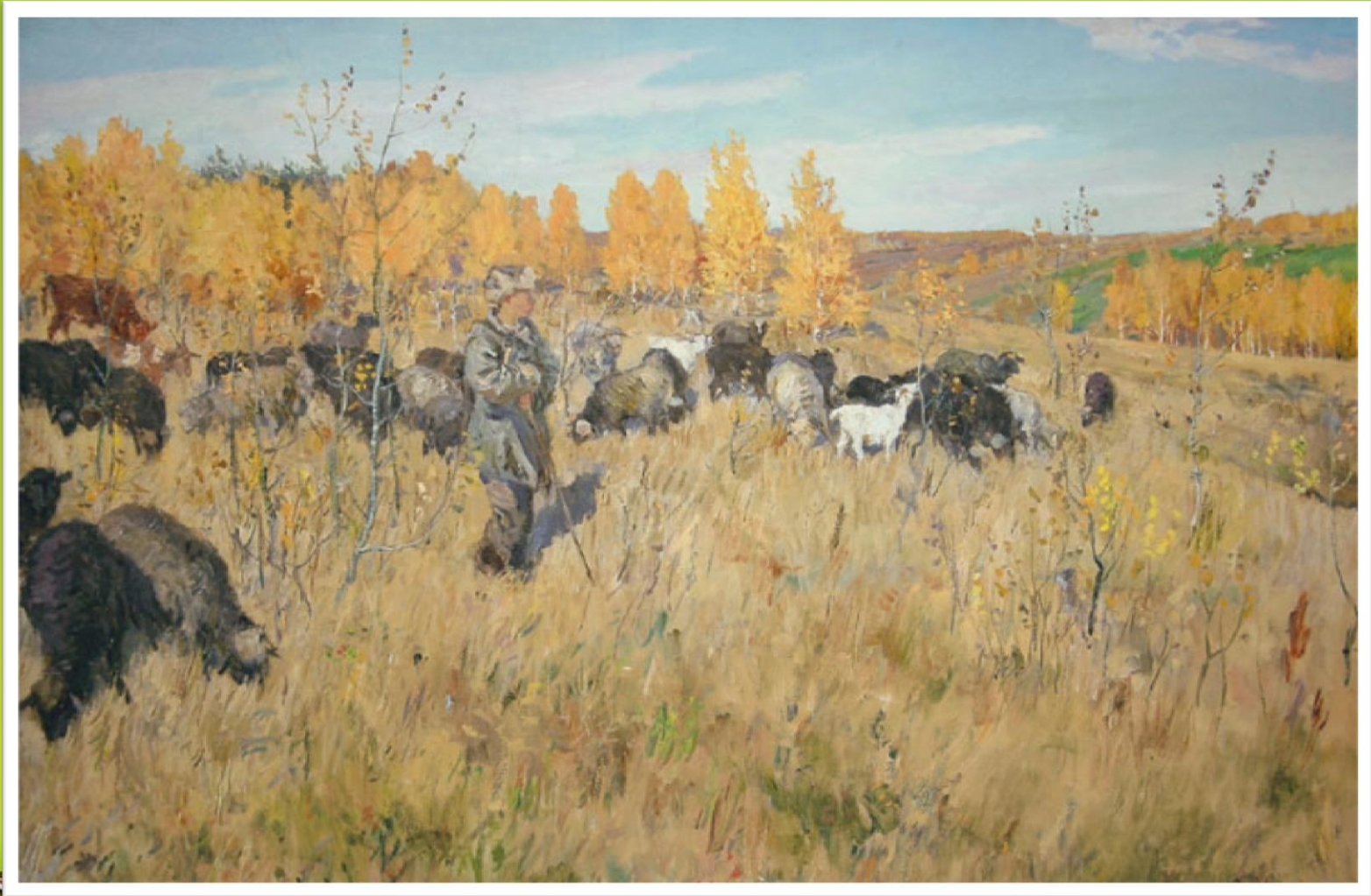
«Овцы пасутся», 1944