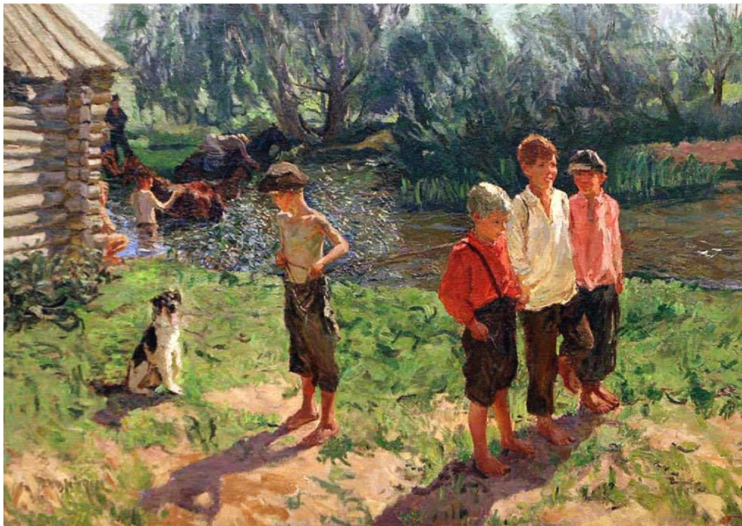
«Тройка. Ребятишки у речки»