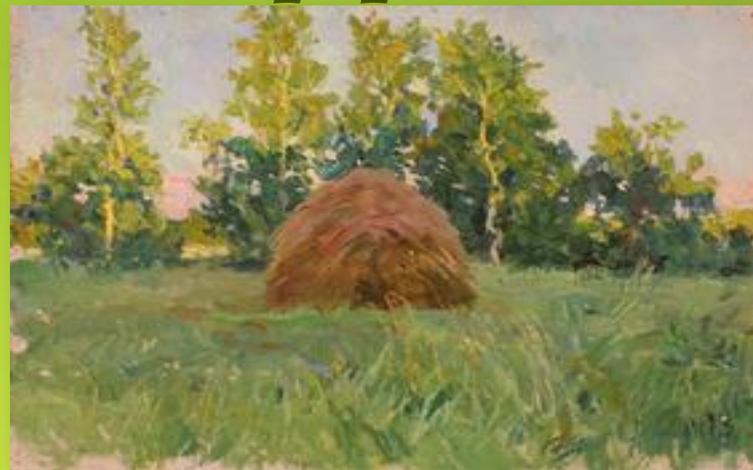
«Июльский вечер», 1940 год