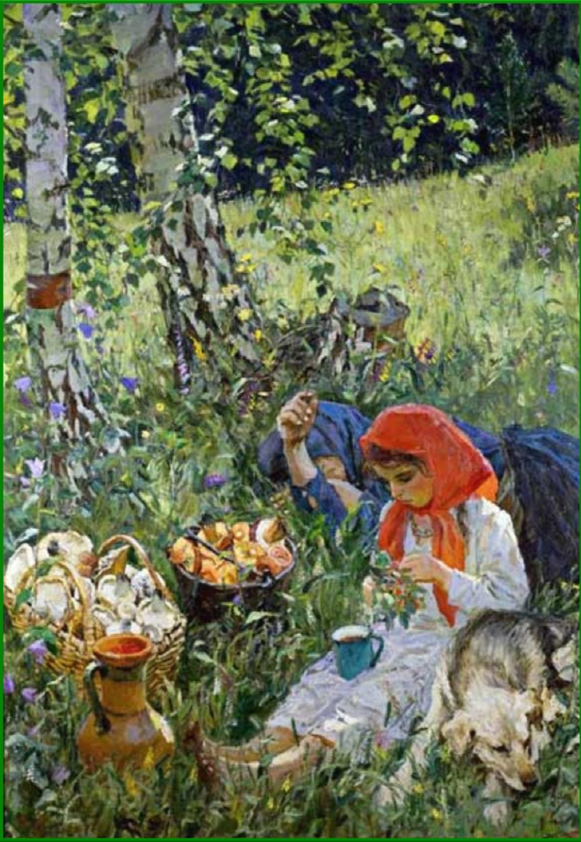
«Летом», 1953-1954 год