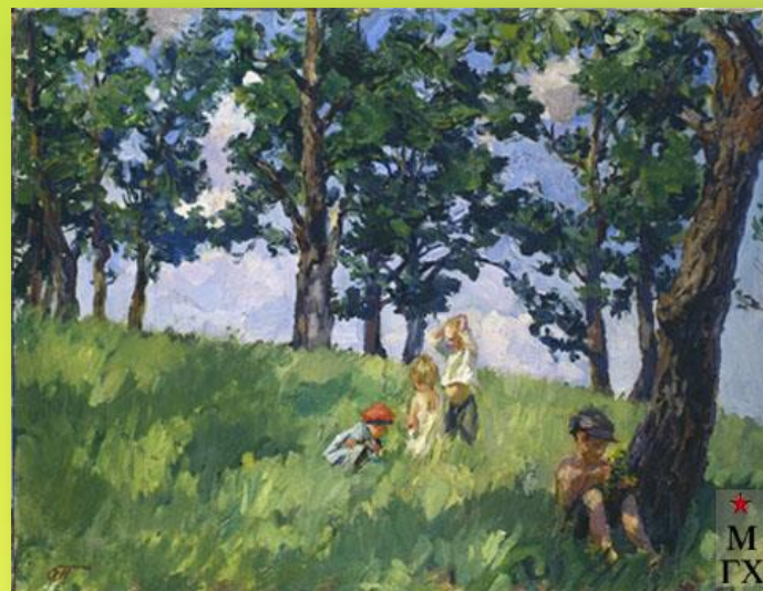
«Пора ягод», 1938-39