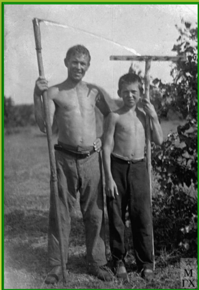
Аркадий Пластов на сенокосе с сыном Николаем. 1940 г.

Я люблю нашу жизнь. ... даже обыкновенные будничные дела наших людей приковывают внимание, потрясают душу. Это надо уметь видеть, замечать. Пластов А.А.