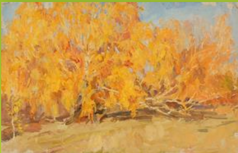
«Золотые березы», 1950