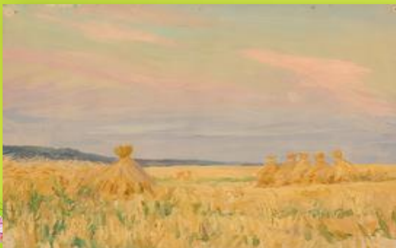
«Стожки», 1952 год