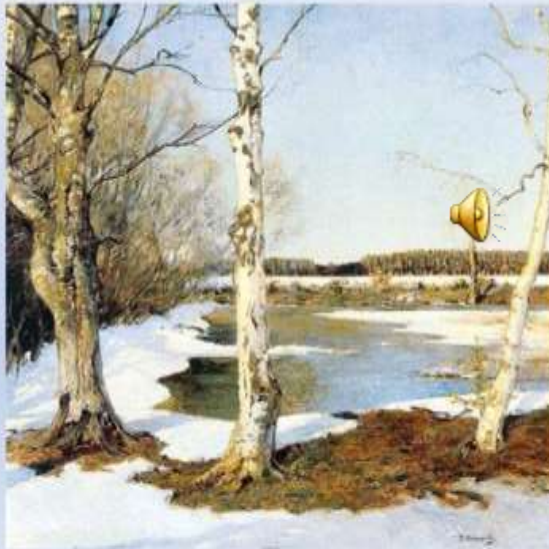
И.С. Остроухов «Ранняя весна»