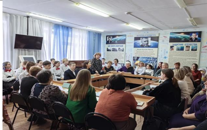
Дискуссии в музее

пускникам школы. Деятельность школьного музея не ограничивается работой с детьми. Так во время городской родительской конференции состоялся разговор с педагогами, родителями и работниками городского музея по теме «Россия - моя история: школьные и городские музеи как пространство преодоления разрыва поколений». Ключевой стала тема духовно-нравственных ценностей, которые традиционно передавались от поколения к поколению. Именно такие родители охотно поддерживают школьные инициативы, изучают с детьми семейные архивы, занимаются проектной работой, не дают усомниться, что школьный музей — это не хранилище артефактов, а пространство для развития, совместного творчества и воспитания наших детей.