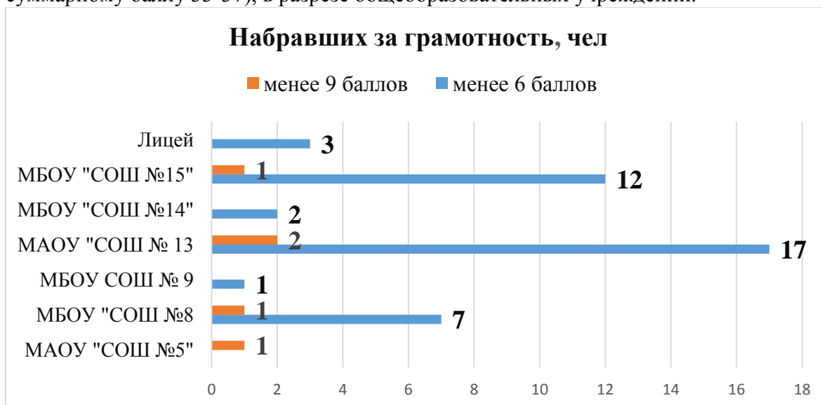
Рис.2 Количество участников, набравших по критериям ГК1-ГК4 за грамотность менее 6(9) баллов в разрезе ОУ

На диаграмме (рис.2) показано количество участников, набравших по критериям ГК1-ГК-4 за грамотность менее 6 баллов (по суммарному баллу 26-32) и менее 9 баллов (по суммарному баллу 33-37), в разрезе общеобразовательных учреждений.