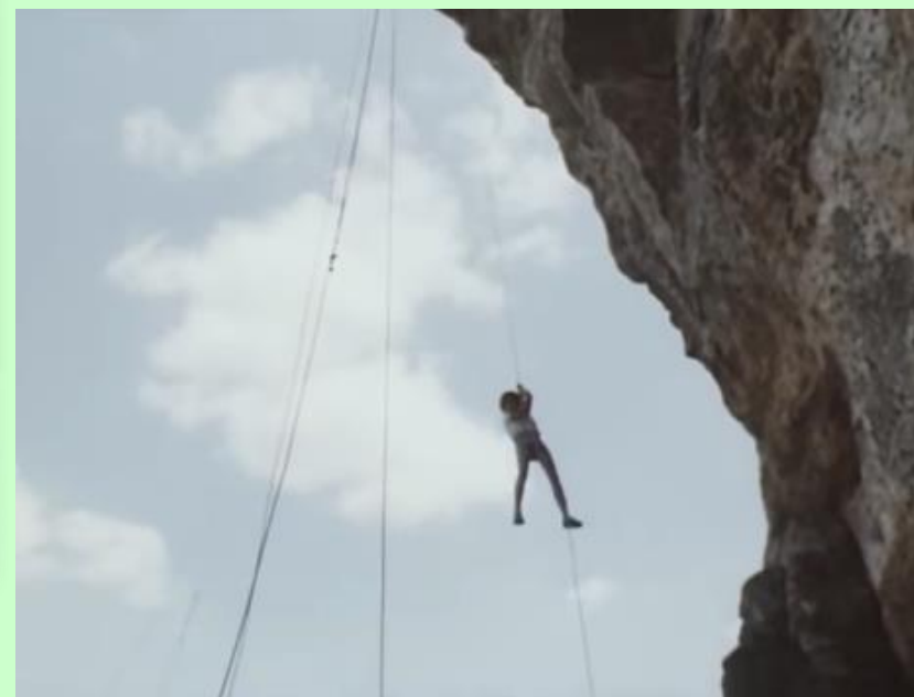
«Каникулы Петрова и Васечкина, обыкновенные и невероятные», 2-я серия, 1984